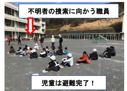
不明者の捜索に向かう職員

1月1日午後4時10分ごろ、石川県志賀町で震度7を記録する地震が発生しました。あまりにも大きな被害に、お見舞いとお悔やみを申し上げます。本校では定期的に避難訓練を実施しており、今回は1月19日（金）のそうじ時間、地震を想定した訓練でした。「災害は、いつやってくるかわからない」たった一人の時でも揺れを感じたら、「DROP! COVER! HOLD ON!」等の安全確保を行い、避難できるようにしたいです。