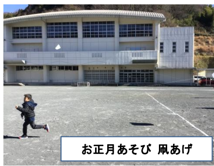
お正月あそび 凧あげ