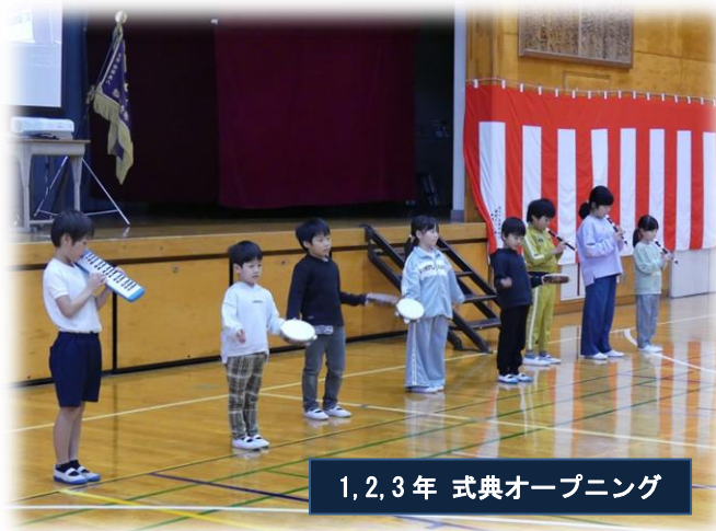
1,2,3年 式典オープニング