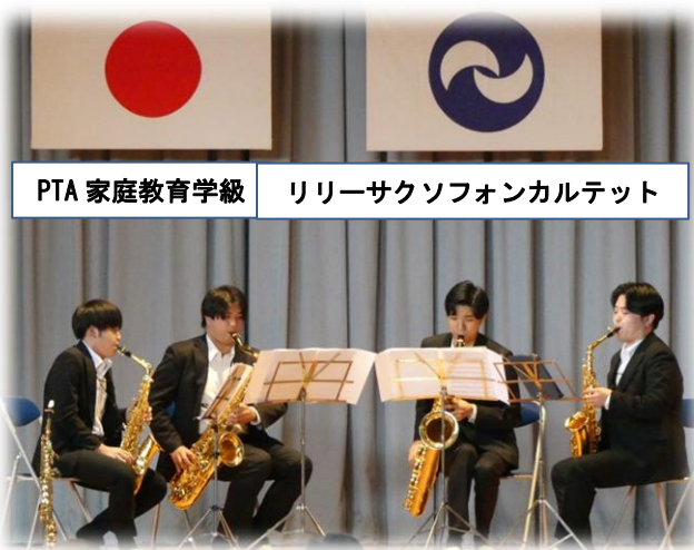
PTA 家庭教育学級 リリーサクソフォンカルテット