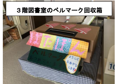
3階図書室のベルマーク回収箱