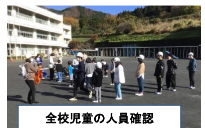
全校児童の人員確認

「災害は、いつやってくるかわからない」という言葉がありますが、本校では定期的に防災訓練を行っています。地震、火災そして不審者対応まで、全教職員が役割分担をして、子どもたちの安全安心、そして命を守ります。最近、熊の出没情報もありますので、ご家庭の協力も、よろしくお願いします。