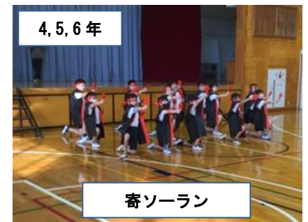
4, 5, 6年